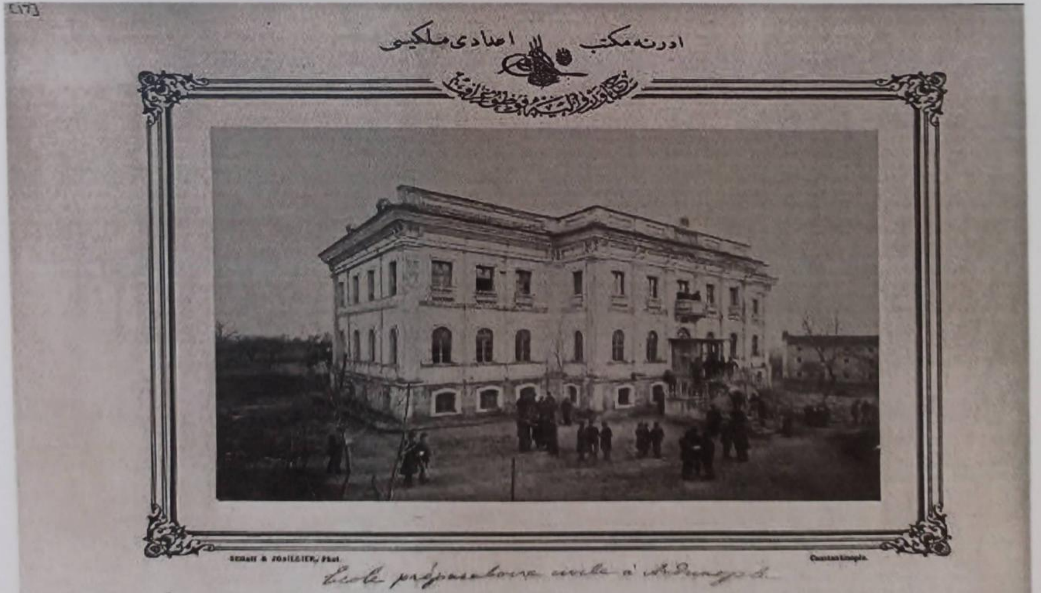
Okulumuzun 1882-1887 Yılları Arasındaki Eklenti ve Ek Kat Yapılmamış Hali